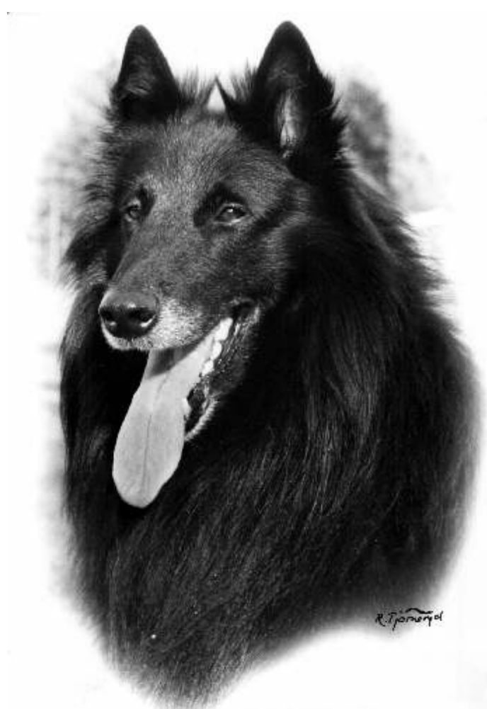
Valkohampaan BLANCODIENTE