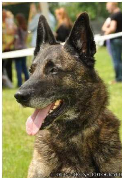
hlava holandského ovčáka