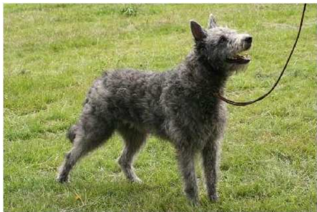
holandský ovčák hrubosrstý