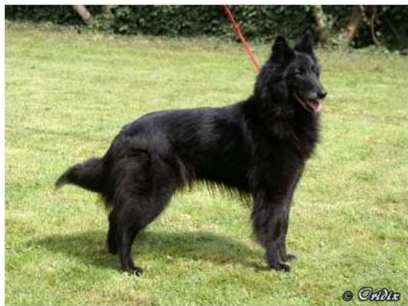
belgický ovčák – groenendael

Bedra, při pohledu shora, musí být užší než záda, jinak je pes příliš tlustý, ale musí být jasné, že jsou silná a pevná, protože standard říká „dobře osvalená“. Suchý pes, šlachovitý a osvalený má vždy silná a pevná bedra. Někdy se stává, že se bedra jakoby zvedají, pohybují (klenou), což je nežádoucí, ale stále lepší než bedra slabá!