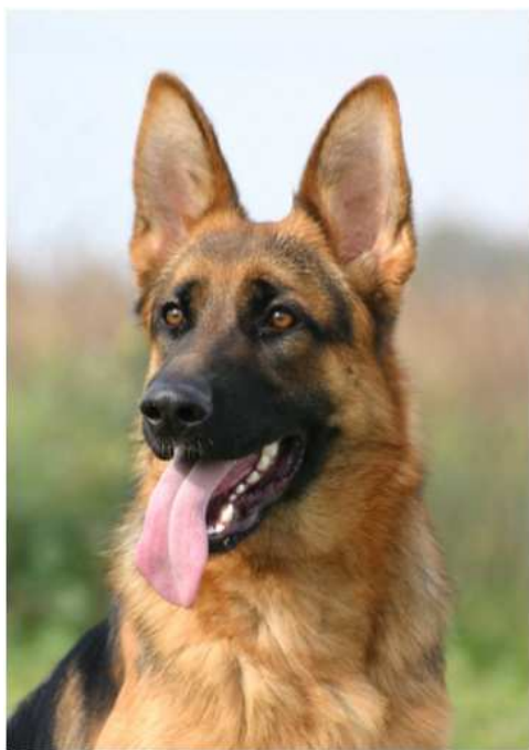
hlava německého ovčáka