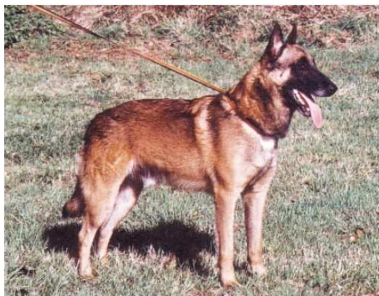
belgický ovčák – malinois

Ve standardu také čteme definici „lýtko správně – dostatečně skloněná – svedená – k hleznům“. U holandského ovčáka říká standard: „v oblasti hlezna je žádoucí mírné úhlení, aby paty byly postaveny na pomyslné svislici vedoucí od bodu zadku“. Z tohoto všeho je zřejmé, že úhlení pánevních končetin u belgického ovčáka i holandského ovčáka je „normální“ nebo „mírné“ a že zadní nohy jsou správně postaveny pod tělem. Toto je pozice typická pro belgické ovčáky, ale už ne pro německé ovčáky, kde delší a více zaúhlená pánevní končetina nutně vede k protažení končetiny dozadu a takový postoj je pak charakteristický pro německého ovčáka.