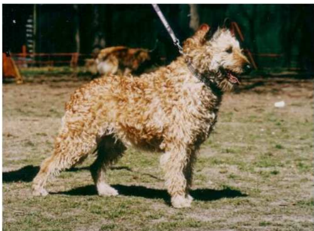
belgický ovčák - laekenois

A konečně přicházíme k zádi, velmi důležité části z anatomického pohledu. K definici „široká ne nadměrně“ můžeme jen zopakovat, co bylo napsáno o zádech a bedrech. Ale ještě je nutné doplnit, že dobrá dostatečná šířka zádi je výjimečně důležitá pro chovné feny, aby dobře a bez potíží rodily štěňátka. Příliš úzká zád' je u fen chyba! Pozice zádi je daná úhlem, který tvoří „prodloužení hřbetní linie“ a „horní linie zádi“. Anatomický základ zádi tvoří pánevní pletenec, spolu s velmi širokým prvním ocasním obratlem. Jestliže je pánevní pletenec, zvláště sama pánev příliš skloněna, je zád' příliš spádovitá nebo strmá. Na druhou stranu, je-li zád' příliš vodorovná, mluvíme o „ploché“ zádi. Nesmíme zapomenout, že pánev je anatomicky nejdůležitější část zádi, je daleko více skloněná než vlastní zád' (sklon může být až 45° vzhledem k horizontále). Pánev je také více či méně paralelní s nadloktím. To je důvodem, proč občas mluvíme o paralelismu mezi přední (hrudní) a zadní (pánevní) částí u psa.