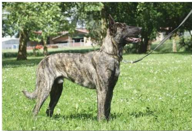
holandský ovčák - krátkosrstý