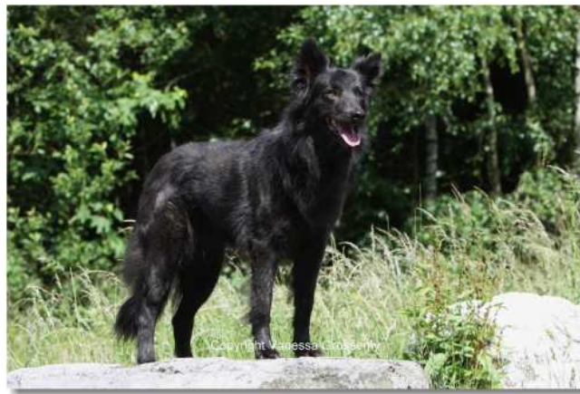
holandský ovčák dlouhosrstý