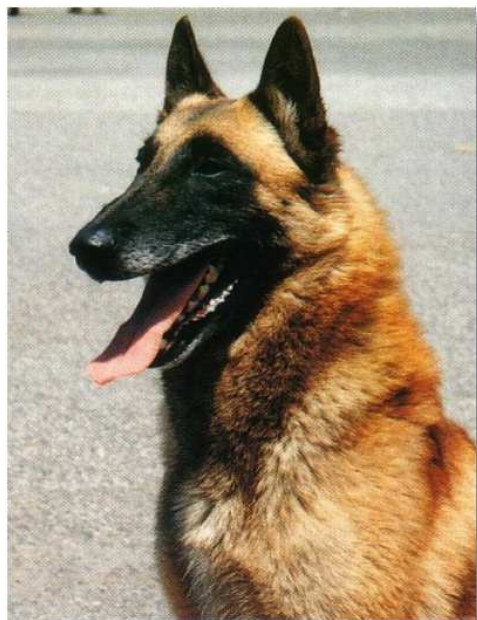
hlava belgického ovčáka

ucho menší než německý ovčák. Čím si můžeme být zcela jistí je fakt, že uši belgického ovčáka jsou velmi typické pro plemeno a že jsou menší než u HO a samozřejmě menší než u NO. Otázkou zůstává, zda by standard neměl rovnou říkat „malé ucho“ anebo „ucho poněkud menší“. Na výstavách je stále vidět mnoho BO s velkým nebo příliš dlouhým uchem. Na druhou stranu i příliš malé ucho je velmi rušivé. Dalo by se říct, že ucho by mělo odpovídat velikostí a délkou velikosti a délce hlavy.